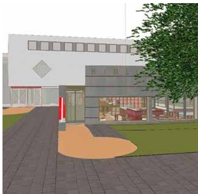
Artist impression OBA Buitenveldert na verbouwing

Eind juni/ begin juli organiseren we een feestelijke opening.