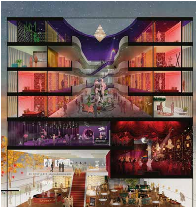
Artist impression Erotisch Centrum

Het participatieproces rondom het Erotisch Centrum laat zien hoe bestuurlijke, eenzijdige keuzes en burgerdraagvlak wringen. Bewoners, ondernemers en sekswerkers voelen zich niet serieus genomen. Ze kunnen wel meepraten, maar hun input heeft nauwelijks invloed op het -alleen door de coalitiepartijen in de gemeenteraad gesteunde- proces. Er is geen enkel draagvlak voor een Erotisch Centrum. Ook niet bij ons eigen Stadsdeelbestuur. Participatie is beperkt tot HOE het Erotisch Centrum er uit mag zien, terwijl de vraag OF de locatie in de oksel van de Europaboulevard überhaupt geschikt is, wordt genegeerd. Net zoals de suggestie dat het centrum een oplossing zou bieden voor de leefbaarheid op de Wallen, terwijl eigen gemeentelijk onderzoek