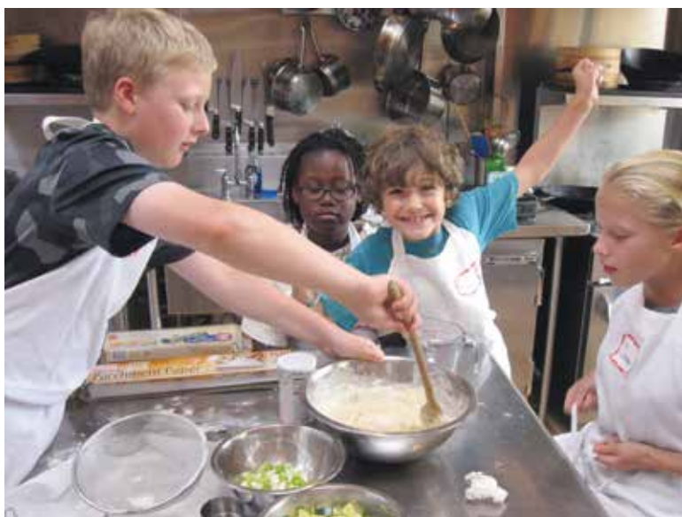
Komt u een hapje eten in het pop-up restaurant?

Juist in een dynamische wijk als de onze is het fantastisch als bedrijven, welzijnsorganisaties en onderwijs-