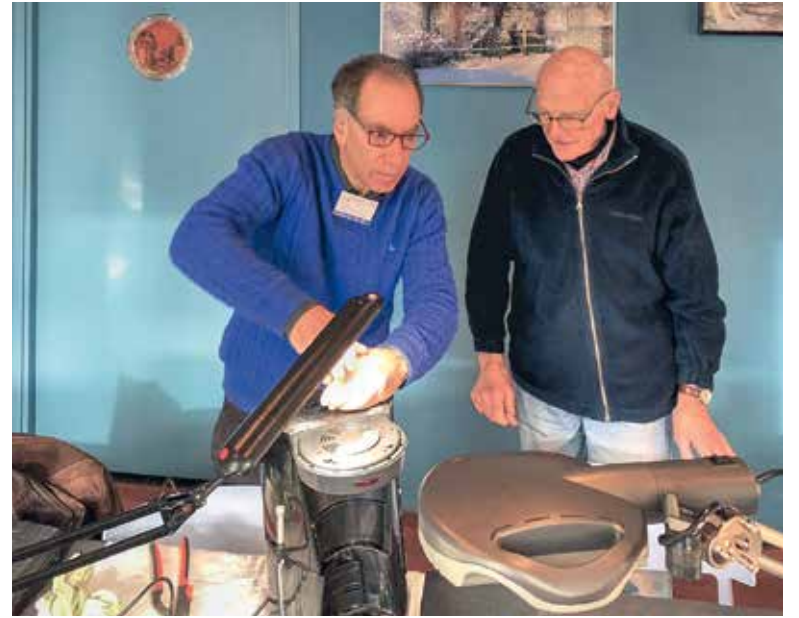
Reparateurs van het Repair Café staan voor u klaar.

Wist u dat het de reparateurs van het Repair Café lukt om twee van de drie defecte producten die buurtbewoners meebrengen weer te repareren? Dat is het resultaat van een aantal jaren Repair Café in het Huis van de Wijk . In ons gezellig Café kijken we samen wat er precies kapot is om het daarna te repareren. Mocht dat niet mogelijk zijn dan helpen we verder met een advies zodat u bijvoorbeeld met een gerichte vraag naar een specialist kunt gaan.