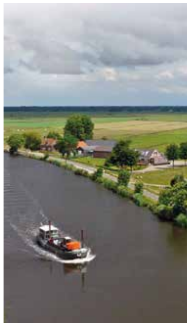
Zondag 3 juni 2018 Amstellanddag.

Locatie: De Klencke 111 Amsterdam (achter Vreugdehof, 50 meter, volg de bordjes)