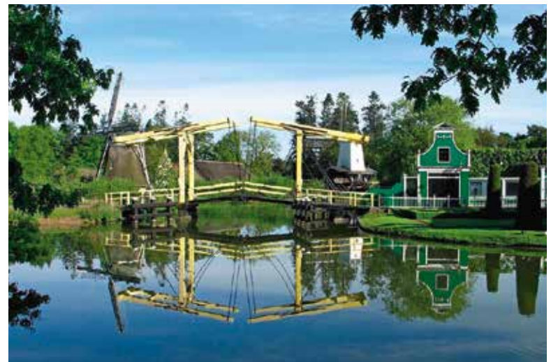
Nederlands Openlucht Museum, Arnhem

Den Bosch: € 10,- (vervoer comfortabele Groengrijs bus). Consumpties en entreegelden zijn voor eigen rekening. Nederlands Openlucht Museum, Arnhem: € 25,- (incl. vervoer comfortabele Groengrijsbus en toegang mu-